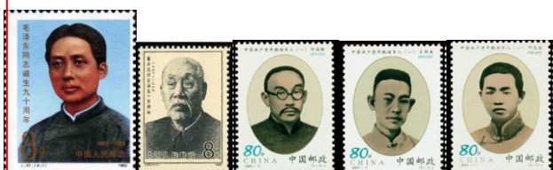
毛泽东 董必武 何叔衡 王尽美 邓恩铭

南成都路辅德里 625 号 （今老成都北路 7 弄 30 号），依然是一处旧式石库门建筑，门楣上的砖雕横批是四个斑驳的字——“腾蛟起凤”。始建于 1915 年的老宅，时隔一个世纪，今天这里已成为上海延安路高架与南北高架交汇处保存最完好的一处石库门建筑群，这里是中共“二大”的召开地。1922 年 7 月 16 日，中共二大第一次全体会议在辅德里召开。中共二大通过了《中国共产党第二次全国代表大会宣言》，制定了党的最高纲领和最低纲领，初步阐明了当时中国革命的性质、对象、动力、策略、任务和目标，指明了中国革命的前途。在宣言结尾处还第一次喊出了“中国共产党万岁！”的口号。“二大”有邓中夏、蔡和森、向警予等 12 位代表全国 195 名党员出席大会，通过党的第一个章程，高君宇当选为二届中央执委，陈独秀当选为中央局书记。 （材料工程学院 冷培榆）